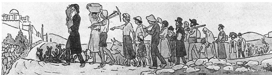
קיבוץ גלויות ועליה לירושלים הבנויה לפי ציור משנת תרפ"ה

בן שנתיים, בנו של הפליט הווינאי. האב מוכה הסנוורים אף הוציא לאור, בעזרת מושך עט ירושלמי, ספר בשם 'מלכות ישראל' שמטרתו להוכיח את משיחיותו של הינוקא. 166