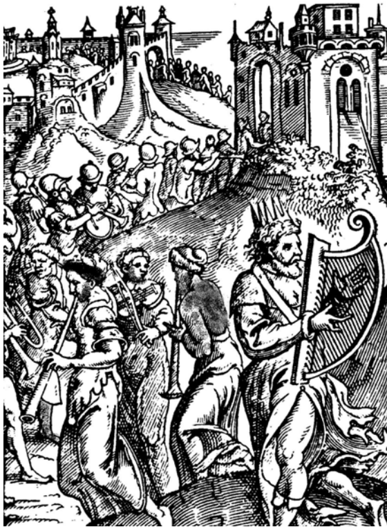
שמחת הגאולה בשערי ירושלים, תחריט משנת ת' בערך

תעמולה לאמונה במשיח בקרב פורקי עול שאין בדעתם כלל לחזור בתשובה, אינה מחישה את בואו. תיקון עצמי של שומרי תורה ומצוות, בעיקר מעוון ביטול תורה שגרם את חורבן בית המקדש, הוא זה שסולל את הדרך לביאת משיח צדקנו. הג"ר רפאל הכהן מהאמבורג, רבו של הגר"ח מוואלוז'ין, לימד פרק חשוב בסוגיא זו: