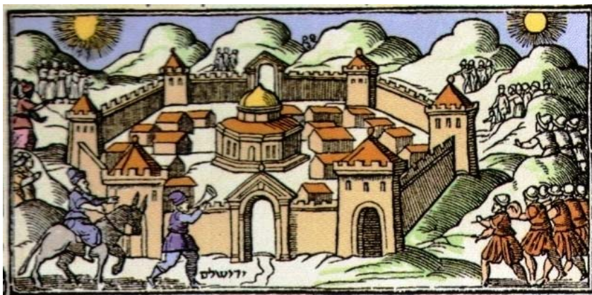
משיח בשערי ירושלים – ציור בהגדת ויניציאה שפ"ט

נשמת המשיח עצמה מתחננת לפני כנסת ישראל שתגלה סבלנות ואיפוק. כך נאמר בתרגום שיר השירים: "יאמר מלך המשיח: משביע אני אתכם עמי בית ישראל, מה אתם מתגרים בעמי הארץ לצאת מן הגלות, ומה זה אתם מורדים בחילותיו של גוג ומגוג, התעכבו פה קמעה עד שישמדו העמים שעלו להילחם על ירושלים, ואחר כן יזכור לכם אדון העולם רחמי הצדיקים ויהיה רצון מלפניו לגאול אתכם". 217