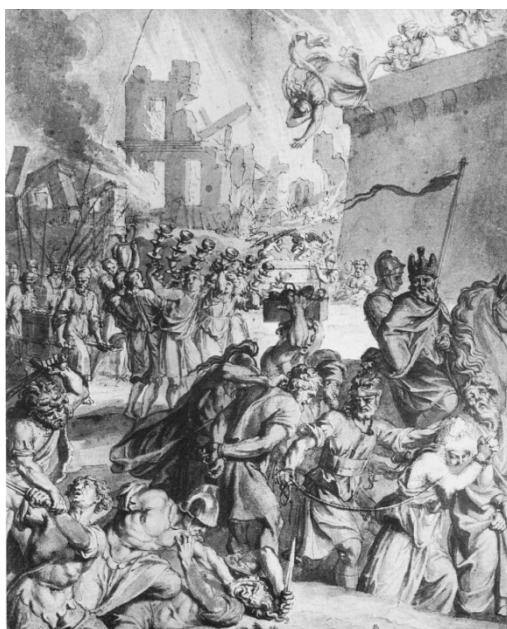
חורבן ירושלים לפי ציור של ברנארד פיקארט בשנת תע"ב

הנה הסכמת רבים מן ההמון, שלכל היותר לא יתאחר ביאת משיחנו ובניין בית המקדש כי אם עד שנת ק"ע לאלף הששי, כי אומרים שבית ראשון עמד ת"י שנים, והבית השני ת"כ שנה, 95 והשם יתברך ינחמנו בכפלים ויהיה בית השלישי לכל הפחות נגד שניהם תת"ל שנים. ותניא, ששת אלפים יהיה העולם, לכן אי אפשר להתאחר אחר ק"ע לאלף הששי. ואמן כן יהי רצון, כי אפשר הדבר. אכן אראה להם פנים אם ח"ו יתאחר יותר, שלא יוכלו להרהר. כי אותה ברייתא מסיימת "שני אלפים תוהו, ושני אלפים תורה, ושני אלפים משיח, ובעוונותינו יצאו מהם מה שיצאו", שהרי לא בא המשיח לסוף ארבעת אלפים. והנה, אפשר אף בעוונותינו יאריך זמן גלותינו, מכל מקום לא יתקצר זמן של שני אלפים של מלכות משיחנו, וזמן אריכת גלות לא יחשב למניין ששת אלפים. 96