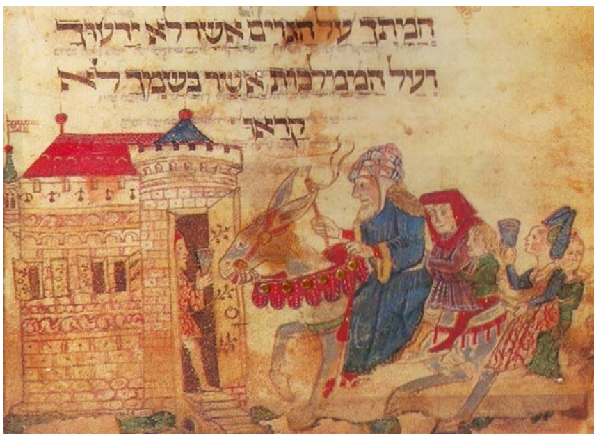
בואו של אליהו הנביא – ציור בהגדת הסופר יואל ב"ר שמעון בשנת רל"ח

הגמרא אומרת שאלהו הנביא היה מקים בזה אחר זה את שלושת האבות אברהם יצחק ויעקב, לעוררם להתפלל על כלל ישראל. אך מנוע היה מלהקימם יחדיו מחשש שמא "תקפי ברחמי ומייתי ליה למשיח בלא זמניה" 176 , והוא נגד רצון ה' שיבוא משיח קודם זמנו מחמת ריבוי תפילה. 177