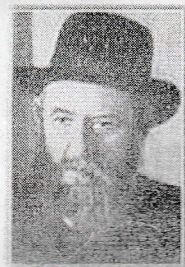
р. Шолом Дов Бер адмор из Любавич, благословенной памяти

"По поводу вашего вопроса о сионистах и их банке, отвечаю вкратце : Даже если бы эти люди были верны Всевышнему и Его Торе, и также если можно было бы подумать, что они смогут достигнуть своей цели - то нам нельзя их слушать в этом (чтобы сделать наше избавление своими руками). Ведь нам даже запрещено приближать избавление умножая молитвы о нем (см. РаШИ Кесувойе 11а и см. Мидраш Шир-ха-Ширим 2) - и тем более применяя материальные усилия и хитрости. А именно, выйти из изгнания силой - мы не имеем права. И не от этого будет наше избавление и выкуп души нашей. И в частности - что это против нашей истинной надежды, ведь все наше ожидание и надежда - что приведет Святой, да будет Он благословен, нам праведного Мошиаха вскоре в наши дни, и будет наше избавление [руками] Самого Всевышнего... И если не дай Б-г удастся им завладеть (святой) землей, как они мечтают, то они загрязнят и осквернят ее своими мерзостями и злодейскими делами и удлинит этим (не дай Б-г) время изгнания.