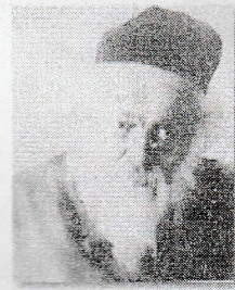
Равви Хаим Соловейчик, благословенной памяти

Книга "Мишкеное хо-роим" Нью Йорк, 5740, том I, стр. 269 (и всем известно)