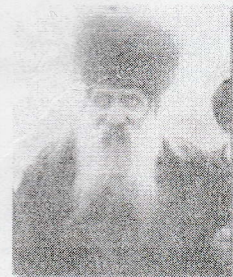
Рабби Иссохор Дойв, адмор из Бельз, благословенной памяти

Книга "Мишкеное хо-роим" Нью Йорк, 5745, том II, стр. 479 от имени "Якут мааморим Ойм Ани Хоймо", кунтрес 6 Иерусалим, 13 Адор 5717 стр 45)