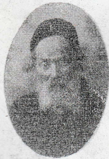
Раввин Израиль Меир Гаконн ("Хофец Хаим"), благословенной памяти

Однажды слышали, как Хофец Хаим говорил о сионистах "Разве возможно, что из них выйдет что-то хорошее, что поместится Шехино на делах их рук?" (Хофец Хаим ал-на-Тора, глава "Бой", Кол Кисвей Хофец Хаим, 70)